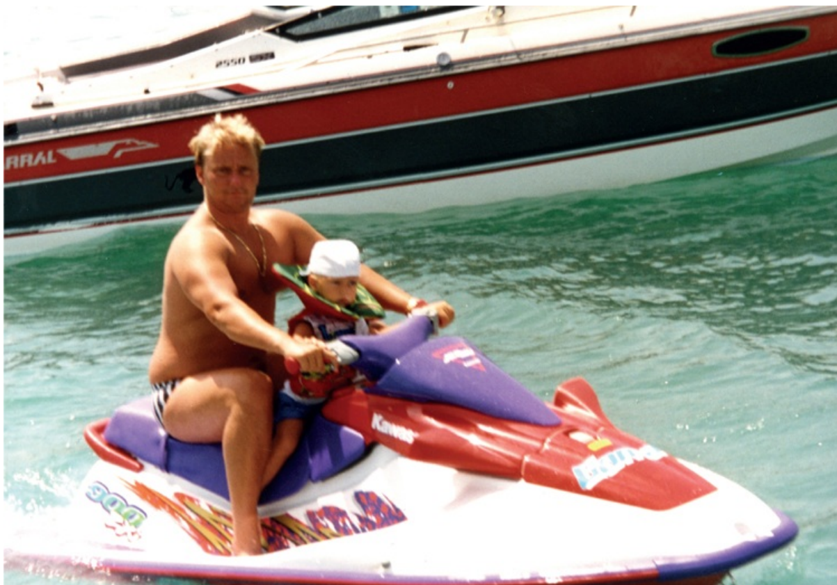
Na de vrijlating in 1992: 'het goede leven' voor de eerste aanslag