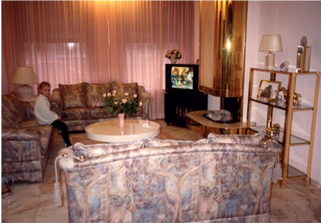
De woonkamer in de Deurloostraat (1992)