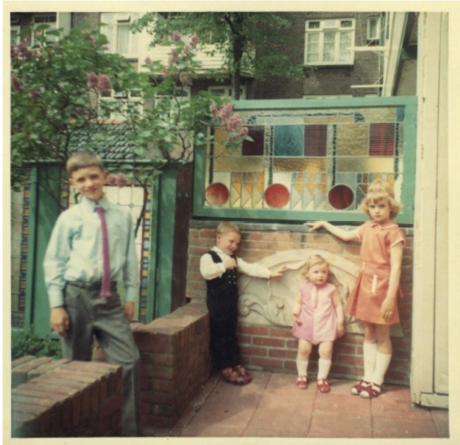
Elke zondag op bezoek bij opa en oma (aan vaderskant) (1967)