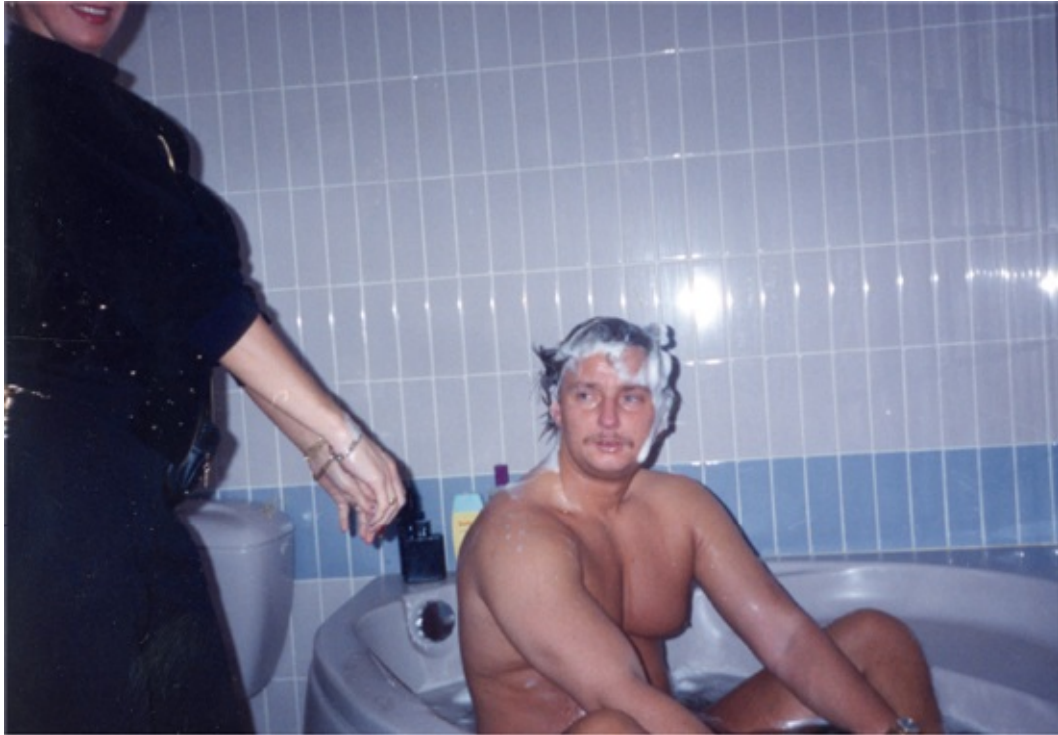
Cor in bad na een avondje 'pikkie pikkie' (1994)