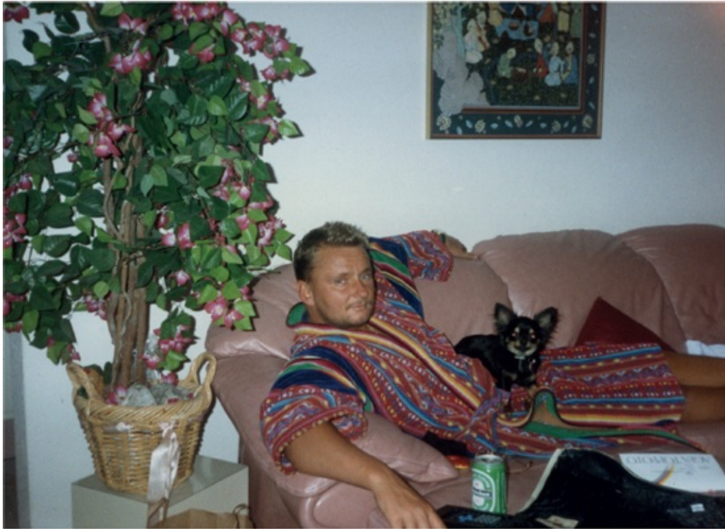
Cor thuis op de bank (1995)