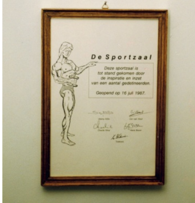
De sportzaal is mede tot stand gekomen dankzij Cor (1987)