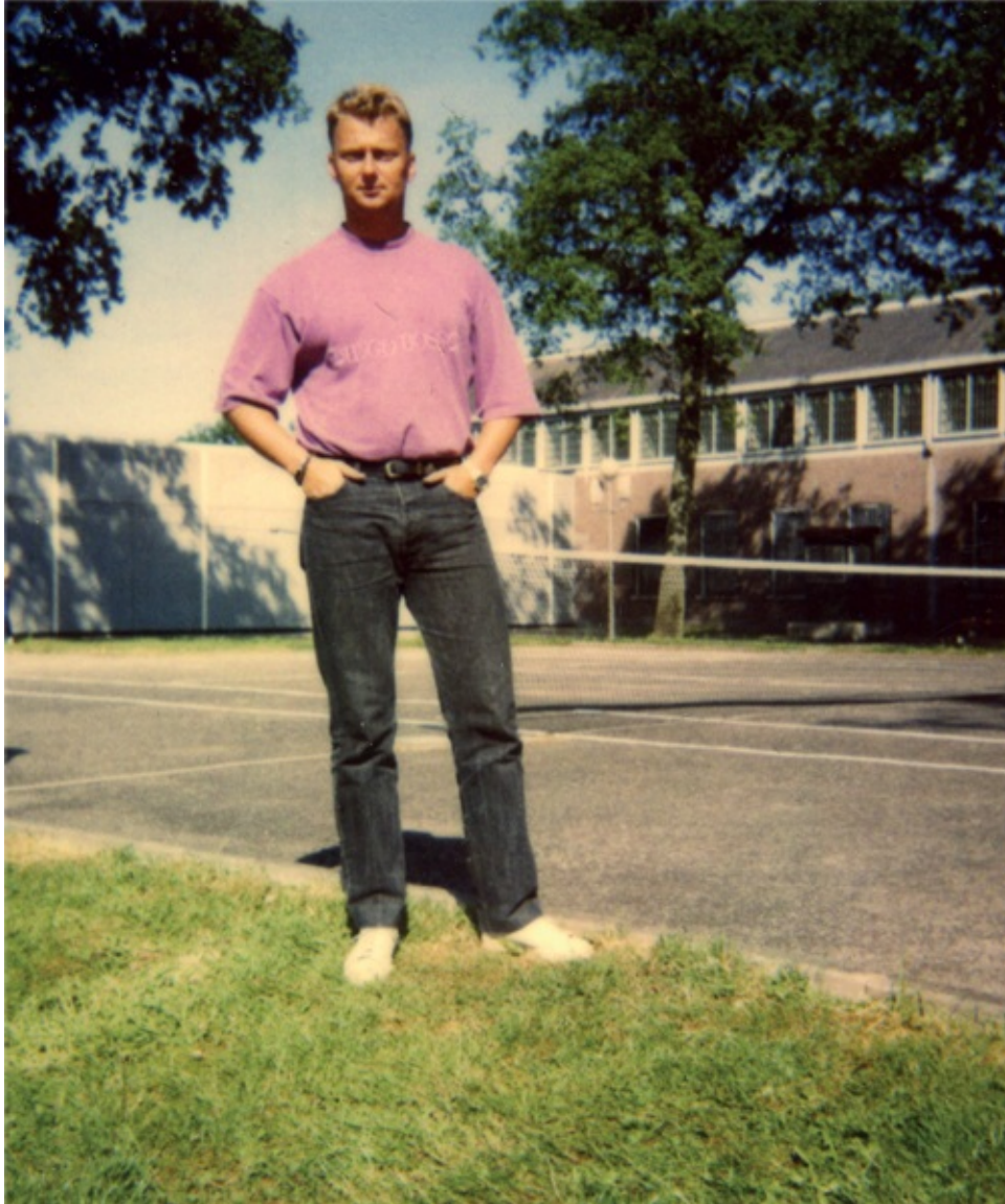
Cor in gevangenis Veenhuizen (1991)